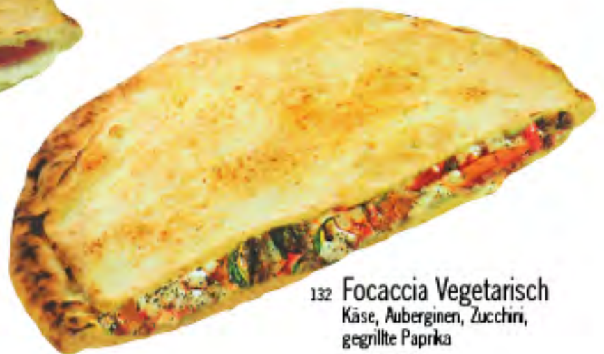
132 Focaccia Vegetarisch Käse, Auberginen, Zucchini, gegrillte Paprika € 4,40