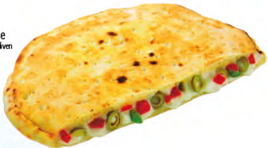
131 Focaccia Caprese Tomaten, Mozzarella, Oliven € 4,40