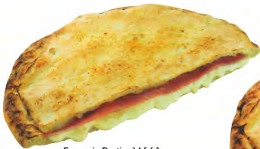
133 Focaccia Rustica 3-4-5-6-8 Käse, Formvorderschinken € 4,40